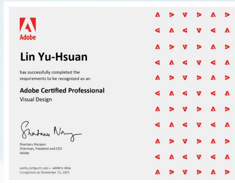
Visual Design 證書