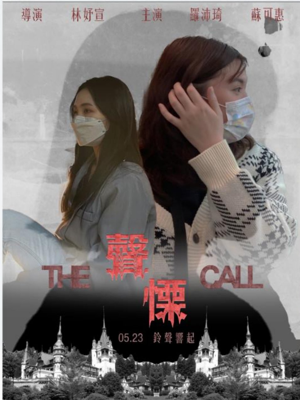
大一下電影海報設計