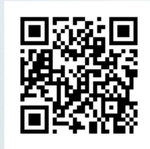
大一下-哈利波特手游廣告