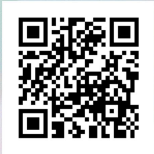
大一上-哈利波特電影解說